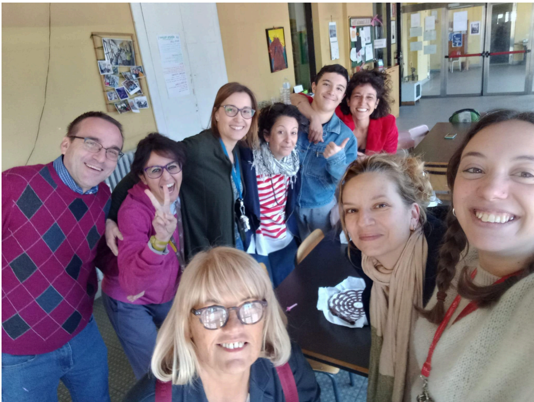
Il personale de Il Carro nella sede di vicolo Carrobiolo 2 a Monza