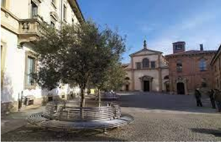
Residenza Costa Alta al Parco di Monza gestita da coop. Meta, socio de Il Carro